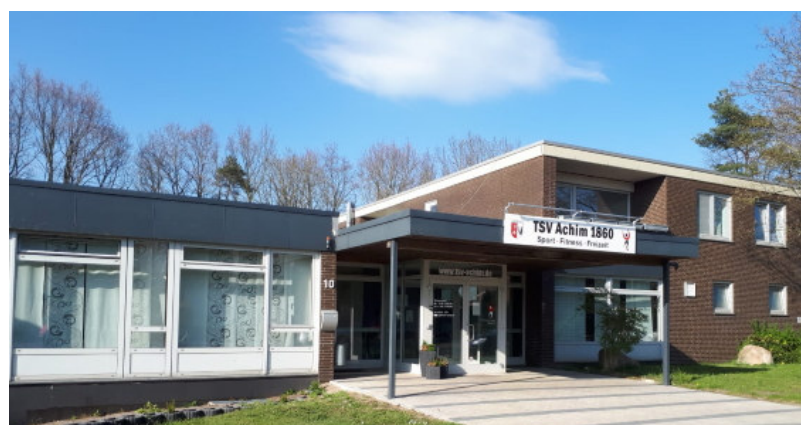
Jugend- und Sportheim des TSV Achim 1860 e.V.

Turnen 1860 Leichtathletik 1860 im Verbund mit Turnen Schwimmen 1893 ab 1912 Schwimmverein Fußball 1903 SV Weser 03 Frauenturnen 1910 Handball 1923 Boxen 1946 aufgelöst 1976 Tischtennis 1947 Ringern 1960 Volleyball 1968 im Verbund mit Turnen Tanzsport 1972 Badminton 1974 Kegelsport 1979 Karate 1980 Basketball 1982 im Verbund mit Turnen Judo 1985 aufgelöst 2019 Radwandlergruppe 1991 Gesundheitssport 1996 im Verbund mit Turnen Aqua Fitness 1996 im Verbund mit Schwimmen Inliner-Skating 2001 im Verbund mit Turnen Sport-Stacking 2006 im Verbund mit Turnen Handicapsport 2008 im Verbund mit Fußball Rollstuhl-Basketball 2016 im Handicapsport Rollstuhl-Rugby 2018 im Handicapsport Power Board 2019 Dartsport 2020