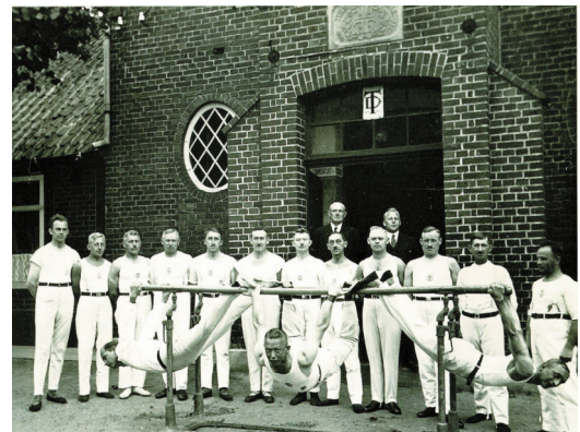
1931 vor der Turnhalle in der Buesstrasse

An dieser Stelle sollte jedoch auch an die Bemühungen früherer Vereinsmitglieder erinnert werden, die sich für die Sportstätten des Vereins eingesetzt haben. Im Gründungsjahr 1860 wurde nahe der heutigen Paulsberg-Schule ein erster, im Sommer nutzbarer Turnplatz mit einer Bretterbude für Turngeräte errichtet. Im Winter hingegen konnte nur beim schwachen Schein einer Petroleumlampe in einem nahe gelegenen Gebäude des Zimmermeisters Schröder geturnt werden. Bereits 1877 machte der Vorsitzende Conrad Gödecke seinen ganzen Einfluss geltend, stellte sein Gartengrundstück an der Buesstrasse zur Verfügung und mit einem Darlehen des Turnermitglieds J. Weber konnte die erste Turnhalle gebaut und am 4. Dezember 1877 eingeweiht werden. Bei späteren Erweiterungen wurden dann auch ein Umkleideraum und Toiletten erstellt. Besonders vorteilhaft war es, dass neben der Turnhalle das Wohn- und Gasthaus der Familie Gödecke lag, die fortan auch als Vereinswirt die Sportler betreuen konnte.