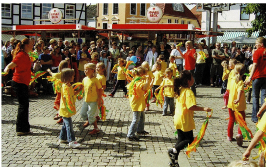
Die Tanzmäuse erfreuen die Achimer beim Stadtfest

Bis zum Jahr 2000 erreichten dann die Mitgliederzahlen eine Höhe von über 3000, da auf Grund des Familienbeitrages viele Mitglieder dem Verein „treu“ und beitragsfrei blieben, obwohl sie aktiv keinen Sport mehr betrieben. Dadurch wurde der Vereinsetat durch Beiträge an Sportverbände und Versicherung unnötig belastet. Mit einer Reform der Beitragsordnung pendelten sich dann die Mitgliedszahlen zunächst um 2200 ein.