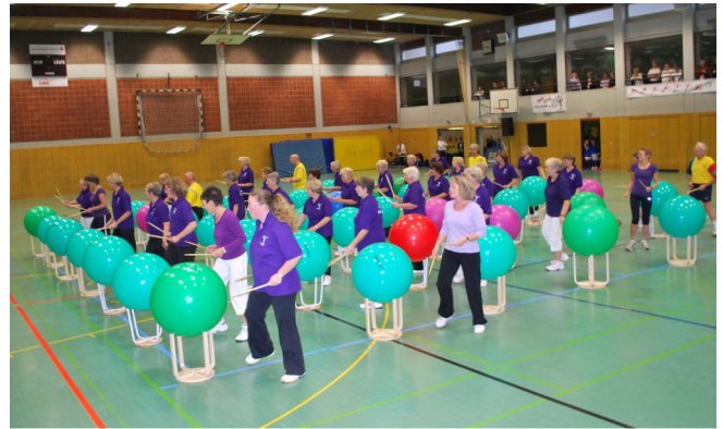
Jubiläumssportschau 150 Jahre TSV Achim