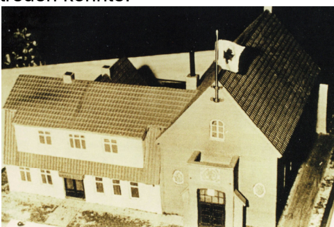
Turnhalle mit Vereinsgaststätte in der Buesstrasse (Modell)

Leider zerstörten im April 1945 Fliegerbomben das Haus des Vereinswirtes und die Turnhalle. Die Tafel über der Eingangstür der alten Turnhalle blieb erhalten und ziert heute das Foyer des Jugend- und Sportheims. Der Wiederaufbau der alten Turnhalle wurde jedoch verworfen, da ihre Abmessungen doch zu beengt waren. So war der Verein lange Zeit heimatlos. Man traf sich zu Versammlungen bei den Achimer Gastwirten, feierte in deren Sälen und betrieb Sport auf den entstehenden öffentlichen Sportplätzen