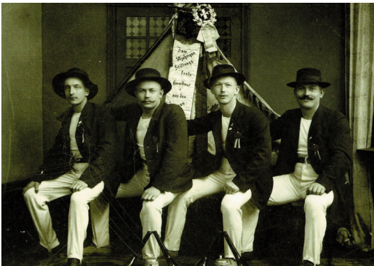
Teilnehmer am Deutschen Turnfest 1912

Dieses Bestreben erwuchs aus den Vorstellungen kritischer Bürger, mehr Mitsprache im politischen und gesellschaftlichen Leben zu erhalten. Doch keiner der regierenden Fürsten und der ihnen ergebenden Obrigkeit wollte etwas von seinem Einfluss abgeben. Vor allem die Turner waren wegen ihres populärsten Vertreters Turnvater Friedrich Ludwig Jahn (1778 - 1852) mit seinen radikalen politischen Ansichten bei den damaligen Machthabern stets unter besonderer Beobachtung.