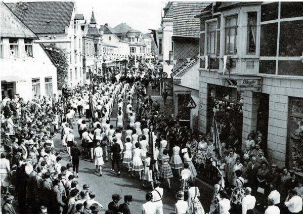
Festumzug 100 Jahre Turnen in Achim

Direkt nach dem Zweiten Weltkrieg fand Sport kurzzeitig nur im Verborgenen statt, wurde dann aber von den Siegermächten wieder erlaubt und Turnen, Fußball und Schwimmen begannen 1946 offiziell wieder ihren Übungsbetrieb in eigenständigen Organisationen. Das entsprach jedoch nicht dem Willen der Militärregierung, die eine leichtere Kontrolle vorsah. Deshalb wurde Gerhard von der Poll beauftragt, alle Sportarten in einem Verein zu vereinen. Der Widerstand gegen eine dritte Zwangsvereinigung war zwar insbesondere durch die großen Sportarten wie Turnen oder Fußball sehr groß, doch 1948 erfolgte die Gründung des neuen Vereins unter dem heutigen Namen „Turn- und Sportverein Achim 1860 e.V.“ mit den Abteilungen Turnen, Leichtathletik, Fußball, Schwimmen, Boxen und Tischtennis. Zahlreiche weitere Sportarten fanden im Laufe der Zeit den Weg in den TSV und führten zu einer Bereicherung des Vereinslebens.