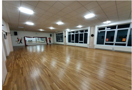
Blieb in diesem Jahr leider einige Wochen leer: der Spiegelsaal im Vereinsheim

Wir hoffen, dass wir Euch durch die Möglichkeit, in diesem Jahr auch in den Sommerferien trainieren zu können, etwas für den Trainingsausfall entschädigen konnten. Leider muss auch unser groß angelegter Jubiläumssball, um den sich